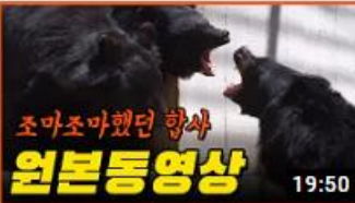
사육곰 곰이의 합사 원본 동영 상을 공개합니다