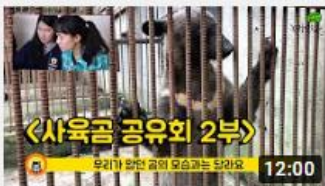
비쩍마른 곰들을 구출하기 위 한 17년의 노력, 사육곰 공유...