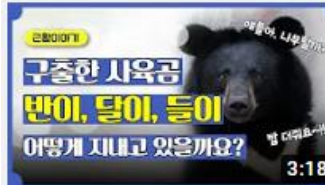
사육사님이 들려주시는 반이, 달이, 들이 근황이야기