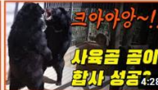
사육곰 곰이 구출 이후 1년 5 개월 만에 진행된 합사!! 과연...