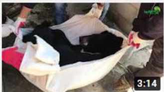
반, 달, 곰 그리고 들이 구출 완 료!