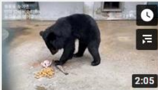
웅담채취용 사육곰 구출 한달 후 : 임시보호소 방문