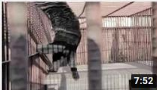
철장 속에 갇힌 야생 사육곰 "37년의 이야기"