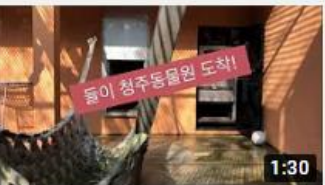
0924 bear free 2