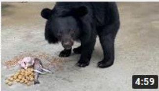
구출한 사육곰 반이 - 식사영 상