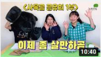
철장 속에서 나온 곰들은 어떻 게 지낼까요? 사육곰 공유회 ...