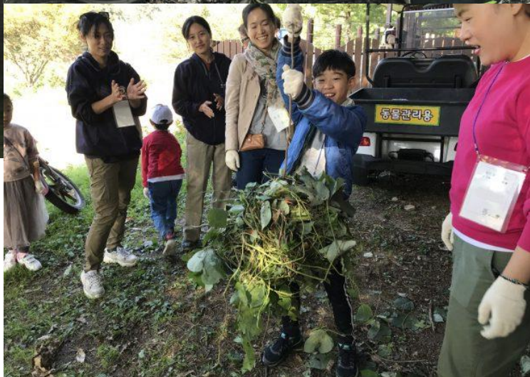
사육곰 보호소 (청주동물원) 방문