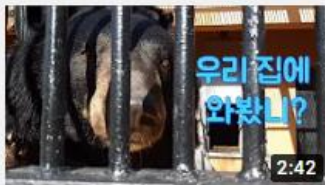
반이, 달이, 들이네 집들이 다 녀왔어요~!